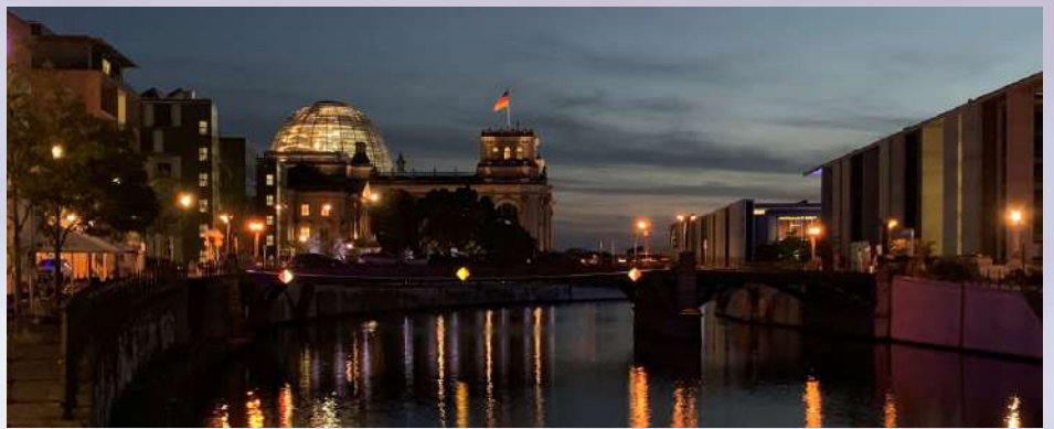
Abendstimmung an der Spree mit dem Reichstagsgebäude. Auch Berlin war die vergangenen Wochen eingetaucht in eine unwirkliche Atmosphäre: Ganz ruhig und sehr angespannt zugleich.