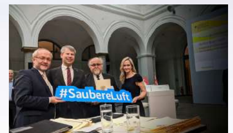
Geld für die Stadt Siegen: Vom Bund gibt es gut 135.000 Euro aus dem Förderprogramm „Saubere Luft“ für Siegen. Den Bescheid für einen entsprechenden Zuschuss für Elektrofahrzeuge und Ladestationen wurde in Berlin von Verkehrsstaatssekretär Steffen Bilger in Anwesenheit von Volkmar Klein überreicht.

Jeweils zum 1. Juli steigen die Renten entsprechend der Lohnentwicklung des Vorjahrs. Das sind diesmal stolze 3,45%. Damit nehmen die Rentner teil an der sehr guten wirtschaftlichen Entwicklung des zurückliegenden Jahres. Gleichzeitig machen die Zahlen deutlich, dass die bisher gute wirtschaftliche Entwicklung Deutschlands sich eben nicht auf Billiglöhne stützte. Statt dessen sind die Löhne auf breiter Front gestiegen und das wird gut abgebildet in den unbestechlichen Rentenzahlen. Bei einer Inflation von nur 1,4% bedeutet das im übrigen echt mehr Geld, nun auch für die Rentner.