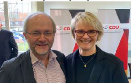
Bundesforschungsministerin Anja Karliczek war bei der CDU in Südwestfalen zu Gast. Die künftige Versorgung mit sicherer Energie und deren Speichermöglichkeiten sind wichtiger Teil der Forschungsförderung.