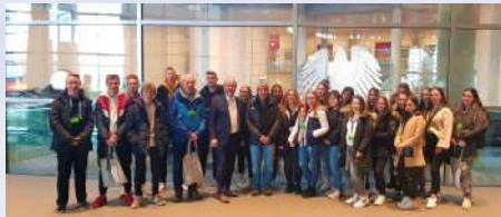
Schülerinnen und Schüler vom Gymnasium Schloss Wittgenstein in Bad Laasphe noch vor Corona zu Besuch im Bundestag

wehr durchgeführt. Im Rahmen von Amtshilfe leistet die Bundeswehr deutschlandweit vor allem Personal- und Transportunterstützung. Es werden an die 15.000 Soldatinnen und Soldaten samt Reserve mobilisiert, um die zivilen Behörden im Notfall zu unterstützen. Die Bundeswehrkrankenhäuser sind bereits im Einsatz. Gut, dass es auch noch mal Berichte darüber gibt, was alles bei der Bundeswehr gut läuft, denn manche Medien haben sich in der Vergangenheit zu einseitig nur auf sicher vorhandene Probleme konzentriert. Die Bundeswehr macht einen erheblichen Wandel durch, denn gegen Terror oder heute reale Cyberbedrohungen werden über konventionelle Panzer hinaus viele neue Antworten gebraucht und gegeben.