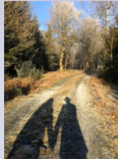
Unterwegs in den Wäldern des Siegerlands und Wittgensteins. Aber derzeit nicht in Gruppen!

Kredite in Höhe von 156 Mrd. Euro aufgenommen werden, nachdem bisher wie in den vergangenen Jahren keinerlei Kreditaufnahme vorgesehen war. Das bisherige Sparen zahlt sich jetzt in der Not aus und hält uns handlungsfähig. Eine Lehre, die wir auch nach der Krise nicht vergessen dürfen.