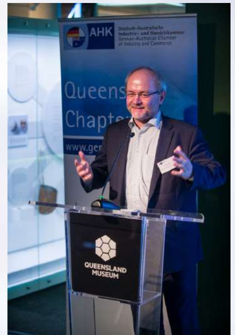
Gespräche und Vorträge in Australien zu den gemeinsamen Wirtschaftsbeziehungen: Die bieten große Chancen, auch für Siegerland und Wittgenstein. Auch heute schon sieht man überall Blefa Bierfässer, Schäfer Mülltonnen, Dometic Kühlschränke und einige weitere Firmen aus unserer Heimat haben gute Marktanteile. Erneuerbare Energien und „Green Steel“ bieten enorme neue Chancen, die wir nutzen müssen im Interesse der Arbeitsplätze bei uns.

Mehr Baustellen, als uns manchmal lieb ist: In Siegen-Wittgenstein wird aktuell sehr viel gebaut. Das führt zwar immer mal wieder zu Staus und Umleitungen, ist am Ende aber ganz wichtig, um die Infrastruktur in unserem Kreis gut für die Zukunft aufzustellen. Das kommt sowohl den Unternehmen wie auch den Bürgern entgegen. Wir werden unsere stark exportabhängigen Arbeitsplätze nur dann auch künftig haben, wenn die Produkte auch zügig ausgeliefert werden können. Dazu werden alleine für die Baustellen des hiesigen Bauabschnitts der A45 rund 537 Mio. Euro investiert. Hinzu kommen noch weitere Straßenbaustellen, bei denen Bund und Land viele Millionen Euro ausgeben.