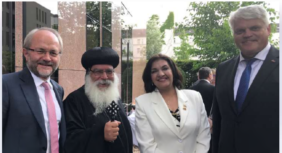
Treffen in Berlin mit Anba Damian, dem koptischen Bischof in Deutschland, einer christlichen Abgeordneten des ägyptischen Parlaments sowie Markus Grübel, dem Beauftragten der Bundesregierung für Religionsfreiheit. In vielen Ländern der Welt werden Menschen wegen ihrer Religion bedrängt oder sogar verfolgt und besonders oft haben Christen darunter zu leiden.