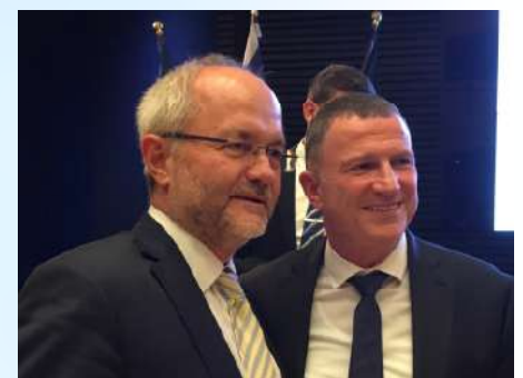
Treffen mit Yuli Edelstein, dem langjährigen Speaker der Knesset, noch kurz vor Corona, in Berlin. Die Freundschaft zwischen Israel und Deutschland muss gepflegt werden.

Ganz viele Menschen in den Krankenhäusern und Arztpraxen unseres Landes sind die Helden dieser Zeit. Dankbar sind wir aber auch all denen, die uns weiter mit Lebensmitteln und dem, was wir zum täglichen Leben brauchen, versorgen. Für ganz viele andere gilt das genauso. Möglicherweise wird das noch einmal ganz neu geschätzt und das wäre sehr gut. Jedenfalls kann man vielfach feststellen, dass eine wechselseitige Wertschätzung deutlich stärker ausgeprägt ist als vor der Krise. Das wäre eine schöne Entwicklung innerhalb unserer Gesellschaft. Für viele neue Formen von Hilfsbereitschaft und Solidarität gilt das genauso. Es ist gut für uns alle, wenn es uns gelingt, einerseits Abstand zu halten und gleichzeitig enger zusammen zu rücken.