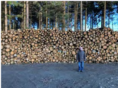
Im Siegerländer Wald: Volkmar Klein vor vom Borkenkäfer geschädigtem Fichtenholz.

Über den Wald redet im Moment kaum noch jemand, aber die Probleme sind nicht kleiner geworden. Die Schäden durch den Borkenkäfer sind enorm und führen vielerorts zu großflächigen Abholzungen, um noch größeren Schaden zu vermeiden. Das ist keine gute Lage für die Waldbauern und unsere Wald- und Haubergsgenossenschaften. Die Holzpreise sind angesichts des enormen Angebots niedrig und werden angesichts der Corona-Krise eher noch weiter unter Druck geraten. Das ist unter sehr vielen Gesichtspunkten sehr schlecht. Ein auch wirtschaftlich lebensfähiger Wald ist uns wichtig, wir brauchen ihn auch als einen Beitrag zum Klimaschutz und gerade in unserer Region ist er ein wichtiges Stück Heimat, das wir schützen müssen.